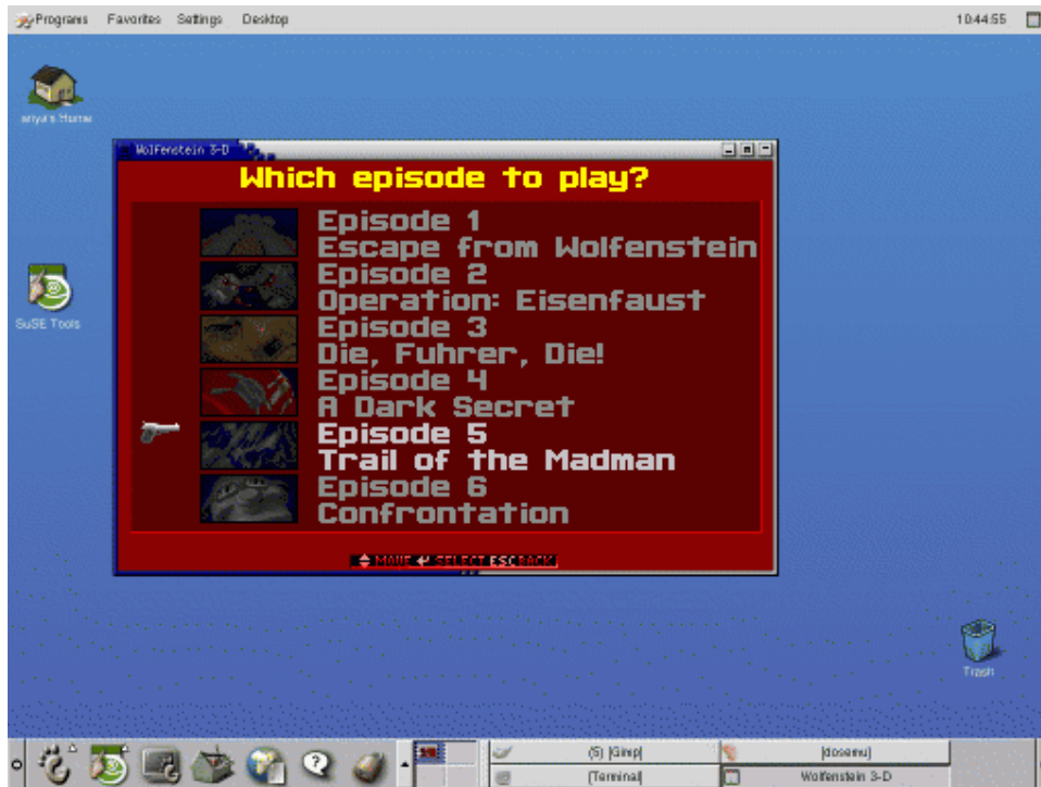
Gambar 2. Wolfenstein 3-D