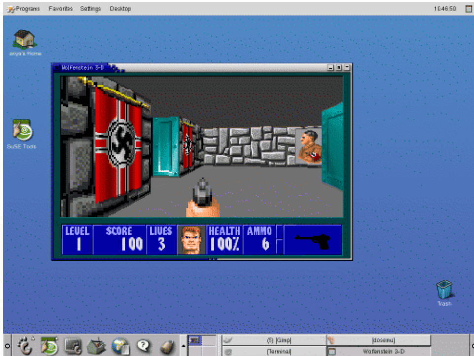
Gambar 3. Achtung ! Achtung !

Bagaimana dengan FreeDOS ? Ah ya, mungkin beberapa pembaca sudah mengetahui keberadaan FreeDOS ( http://www.freedos.org ), sebuah proyek untuk menghasilkan implementasi gratis dari DOS yang kompatibel dengan MS-DOS. Karena juga sebuah DOS, layaknya MS-DOS, maka FreeDOS bisa di-boot dengan DOSEMU. Dengan cara yang sama, Anda bisa membuat hdimage yang bukan memakai MS-DOS, akan tetapi dengan sistem dari FreeDOS. Sayangnya, hingga versi terakhir yang dicoba oleh penulis, ada bagian-bagian tertentu dari FreeDOS yang masih kurang sempurna sehingga belum bisa menjalankan Wolfenstein 3-D. Kelak, jika FreeDOS ini makin bertambah baik, mudah-mudahan tidak ada masalah untuk dapat memainkan Wolfenstein 3-D.